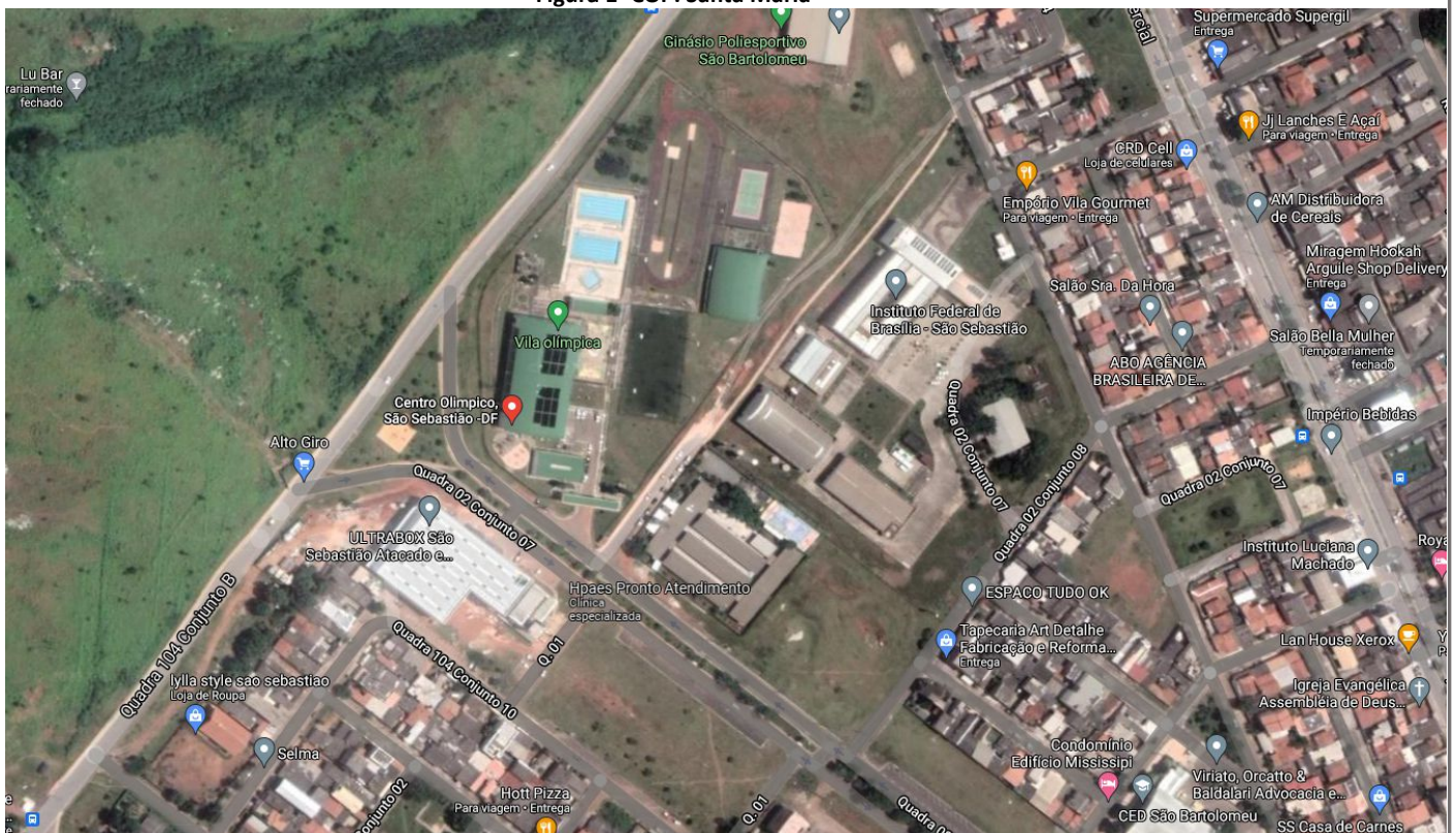
Figura 1- COP. Santa Maria

A quadra coberta está localizada no Centro Olímpico e Paralímpico de Santa Maria, em Quadra Central 3, área Especial 4.