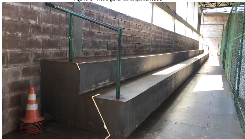
Figura 8- Visão geral da arquibancada