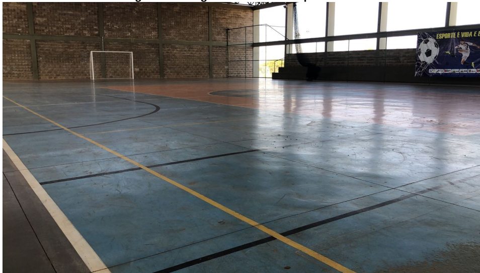
Figura 1- Vista geral do interior da quadra

A equipe técnica desta Secretaria de Esporte e Lazer do Distrito Federal procedeu com vistoria in loco para o levantamento de correções necessárias.