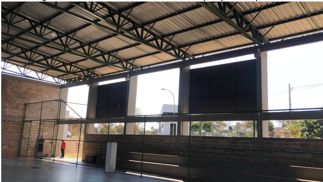
Figura 4- Abertura lateral em toda a sua extensão sem proteção a intempéries