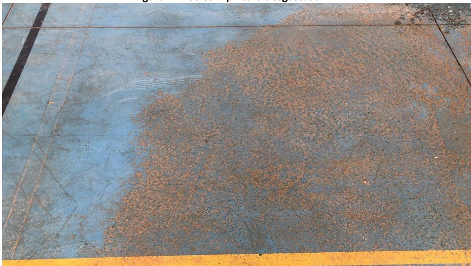
Figura 2- Piso com pintura desgastada