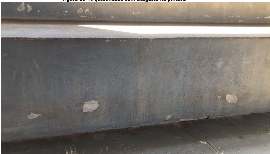
Figura 10- Arquibancada com desgaste na pintura