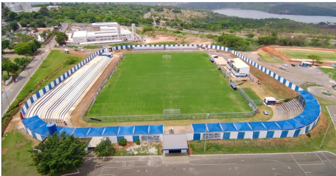
Imagem 3: Estádio JK (Paranoá)