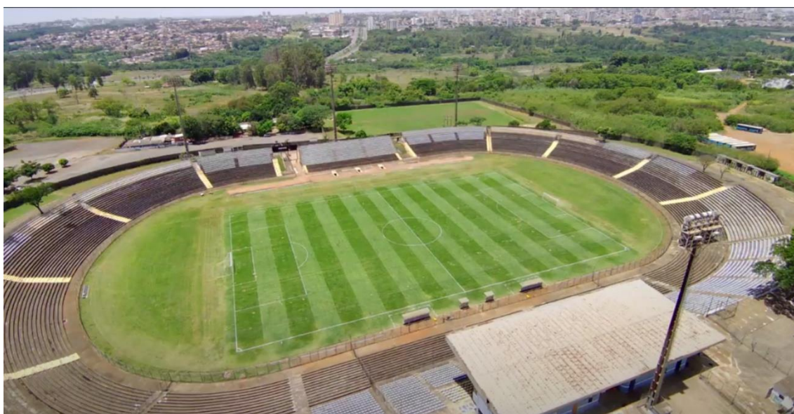
Imagem 2: Estádio Serejão (Taguatinga)