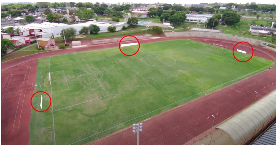
Imagem 1: Estádio do CECAF (Asa Sul). Os círculos em destaque vermelho representam onde as placas ficarão dispostas ao redor do campo.