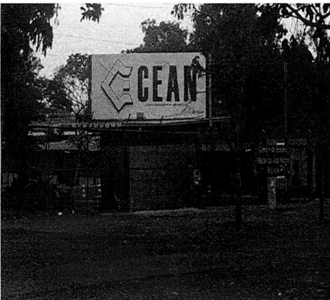
Centro Educacional 607 norte