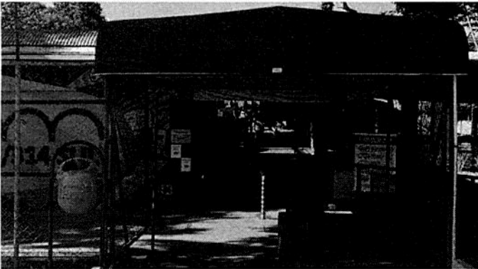
Escola Parque 313/314 sul