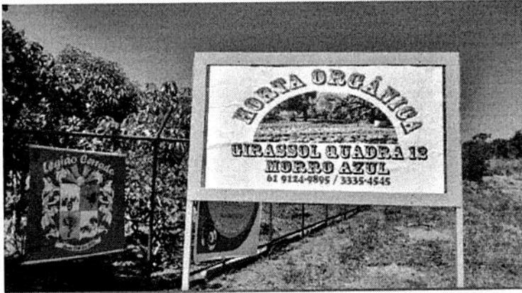
Girassol quadra 12 - Morro Azul