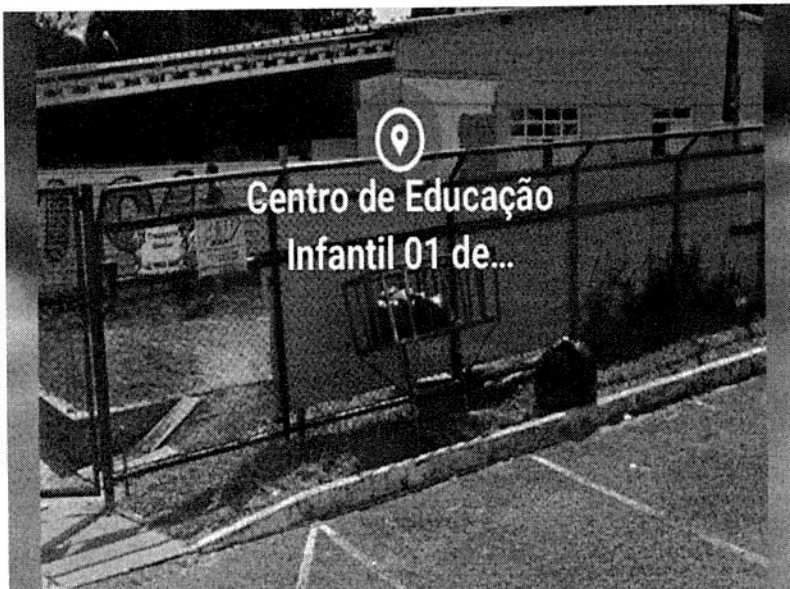
Quadra 2 AE - Sobradinho