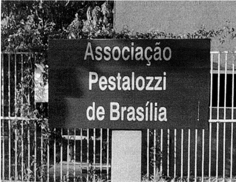
Setor de clubes sul Q.3 Conj. 2- Avenida das Nações