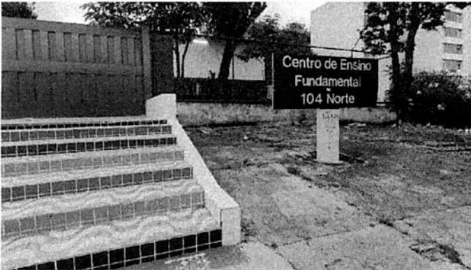
SQN 104 Norte