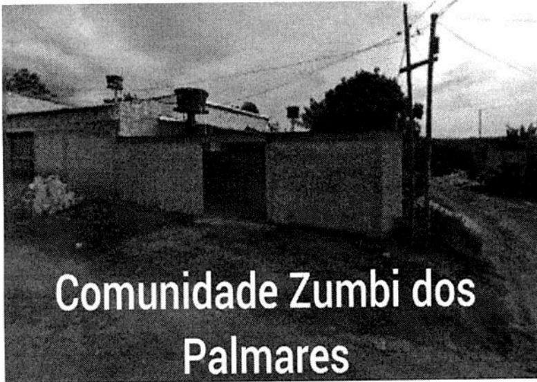
Zumbi dos Palmares – São Sebastião