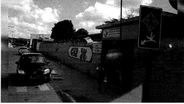
Comunidade Mestre D' Armas – BR 020 mod 7 It 17, 18, 19, 20 – Condomínio Mestre D'Armas